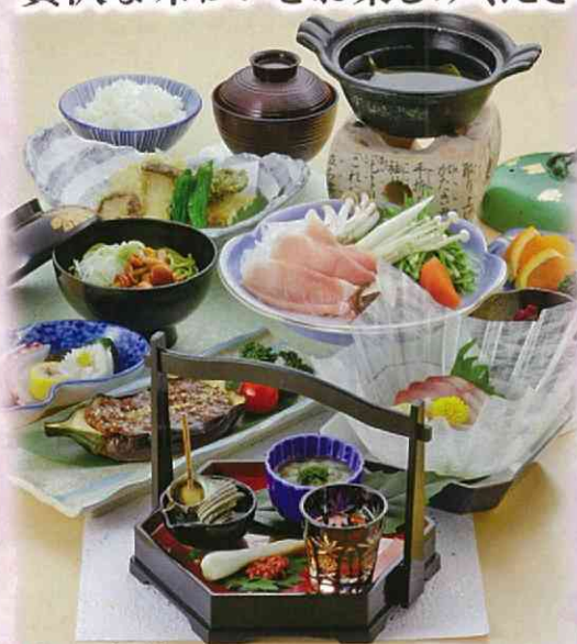
みゆき 御幸膳 お一人様 5,000円