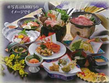
◆ 祝膳 お一人様 6,000円、8,000円