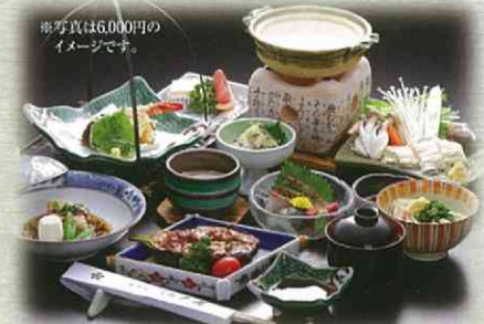
◆ 御法要膳 お一人様 6,000円、8,000円

※御法要の際には、「陰膳」の ご用意も承ります。 ご予約時にお申し付けください。