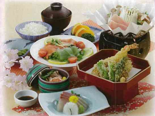
しほう 紫峰膳 お一人様 4,000円